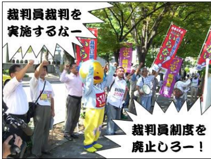
裁判員裁判を実施するなー