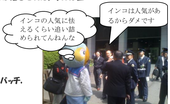
5月27日東京地裁前、記者会見に訪れたインコと弁護団を阻止する守衛と職員

闘い終わっての祝杯は美味であった。乾杯の囀 → (* ^◇^ ) / □ ☆ □ \ ( ^ _ ^ * )